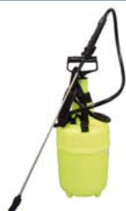
PULVERISATEUR 9L CL