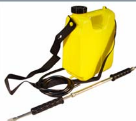
PULVERISATEUR 5L LASER