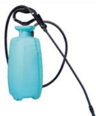
PULVERISATEUR 7,6L CHAPIN - CH 2560